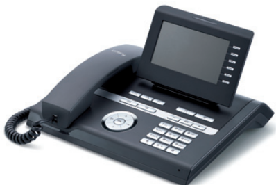
OpenStage 40 T