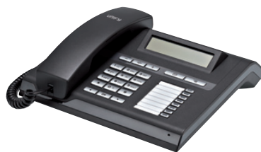
OpenStage 15 T