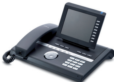
OpenStage 60 T