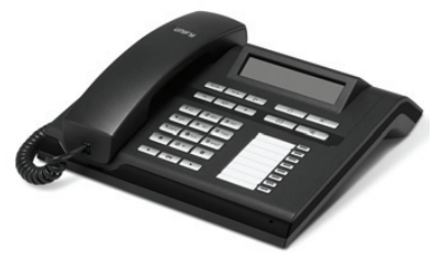
OpenStage 30 T