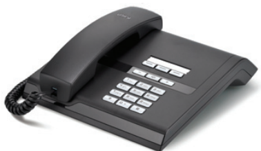
OpenStage 10 T