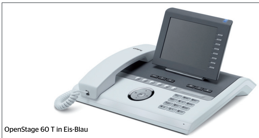
OpenStage 60 T in Eis-Blau

OpenStage 10 T, 15 T und 30 T sind abwärtskompatibel und können wie optiPoint Telefone betrieben werden.